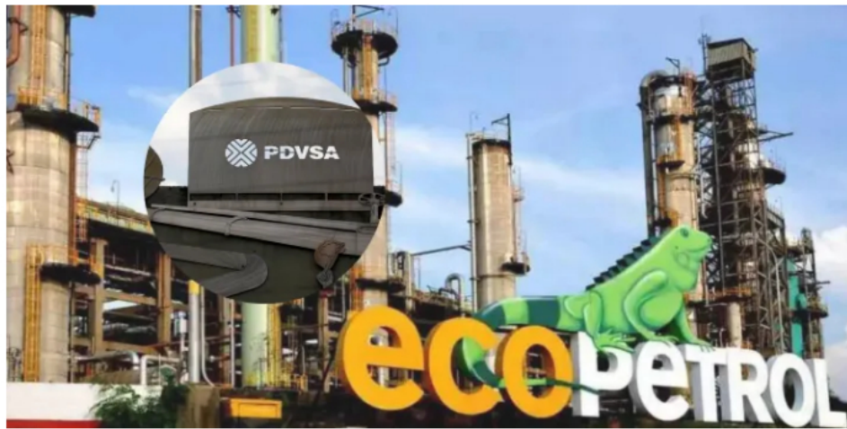
Ecopetrol importaría gas desde Venezuela a partir de 2025.

Ricardo Roa, presidente de Ecopetrol , aseguró que importar gas de Venezuela es una de las opciones que están estudiando ante el déficit de gas.