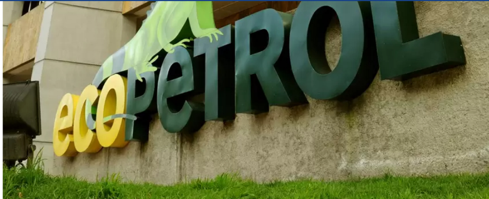
Sede de Ecopetrol