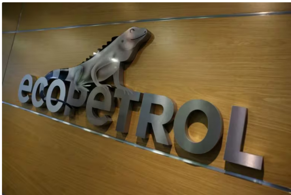
FOTO DE ARCHIVO. El logo del grupo energético colombiano Ecopetrol en la sede de la empresa en Bogotá, Colombia, 11 de julio, 2023.