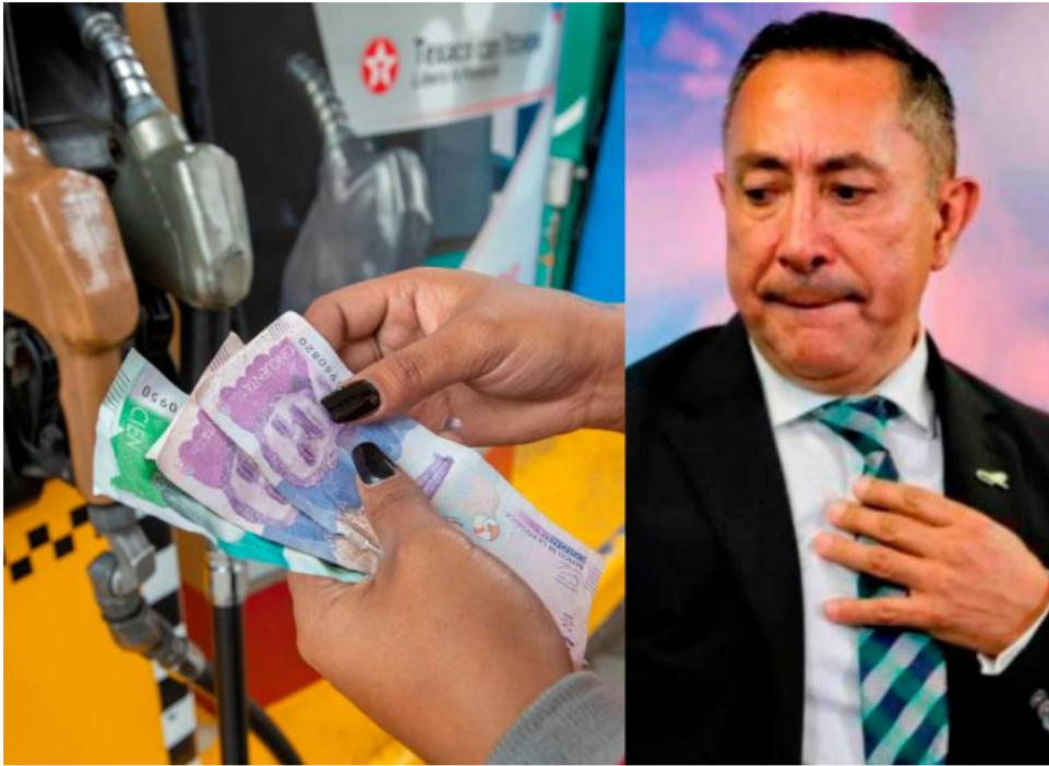
El presidente de Ecopetrol , Ricardo Roa, dijo que el incremento en el precio del diésel en Colombia podría ser de hasta $3.000.

El funcionario advirtió que estos son los números que se están analizando actualmente para realizar el ajuste.