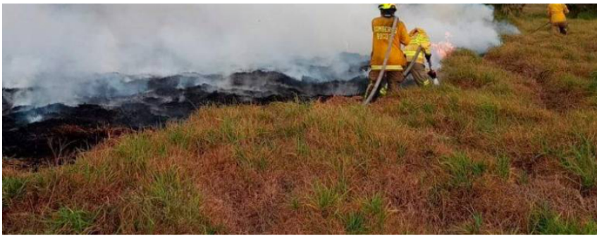
Los bomberos están en el lugar tratando de apagar el fuego de lo que era una quema de pastos controlada.