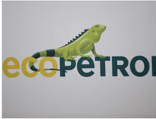
Imagen de referencia de Ecopetrol. Foto: Colprensa.