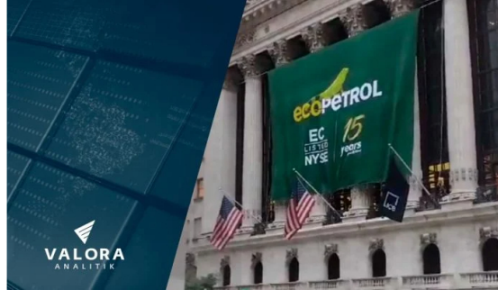
Ecopetrol propone a accionistas grandes cambios para producir energías renovables

La petrolera colombiana estatal, Ecopetrol, busca que la Asamblea General de Accionistas apruebe más reformas a sus estatutos: impulsando la idea del presidente Gustavo Petro de hacer de la compañía una dedicada a la transición energética y la producción de energías renovables.