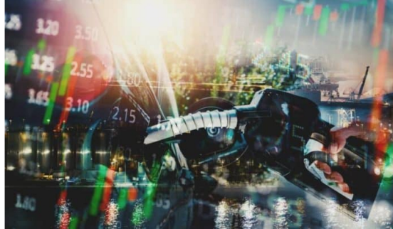
Así subiría el ACPM en Colombia en 2024, según Ricardo Roa de Ecopetrol.

El presidente de Ecopetrol, Ricardo Roa Barragán, expuso su punto de vista frente a una futura alza en el precio de los combustibles , especialmente, del ACPM o diésel en Colombia. ¿Qué propone el ejecutivo?