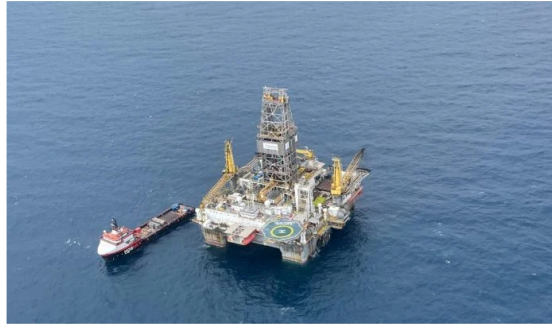
Ecopetrol se alista para iniciar perforación de pozo de gas Uchuva 2, en el offshore colombiano.

El presidente de Ecopetrol, Ricardo Roa Barragán, aseguró que se vienen nuevas iniciativas para seguir explorando el potencial que tienen el mar Caribe de Colombia en gas natural, es por eso que se la petrolera se alista para la perforación del pozo Uchuva 2.