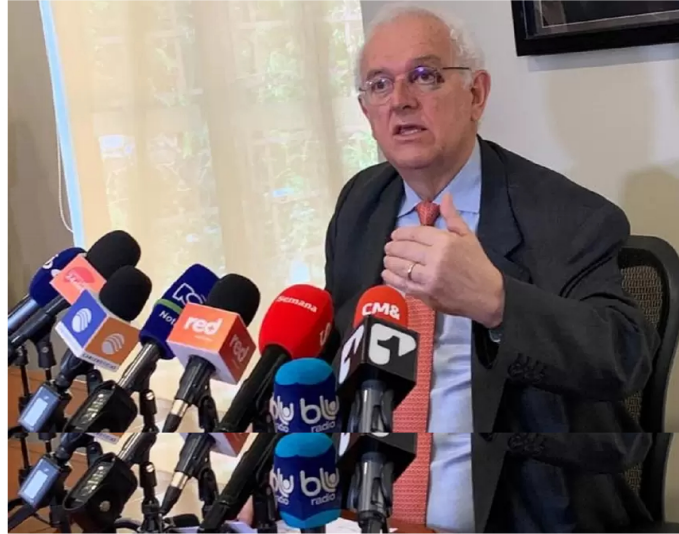
Ministro de Hacienda, José Antonio Ocampo.