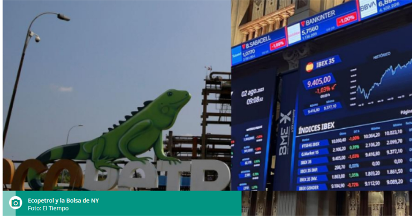
Ecopetrol y la Bolsa de NY

Este lunes, su ADR, en la bolsa de Nueva York cae 3,2 % y suma nuevas pérdidas desde que se conoció su balance de 2023.