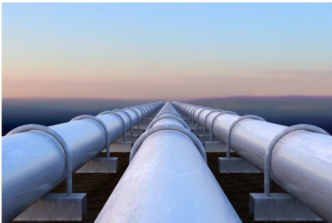
La importación de gas de Venezuela a partir de 2025 generará mayores costos para el valor de este servicio

Sobre esto, indicó que se está hablando de USD17 a USD19 el millón de BTU (Unidad Térmica Británica), cuando lo normal en el mercado es USD6 o USD7 por millón de BTU.