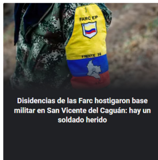
Disidencias de las Farc hostigaron base militar en San Vicente del Caguán: hay un soldado herido

Soldado que asesinó a tres compañeros en Putumayo fue contactado por disidencias de las Farc en redes sociales