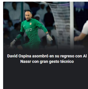
David Ospina asombró en su regreso con Al Nassr con gran gesto técnico

Águilas Doradas vs Junior por Primera A el 8 marzo en el Estadio Alberto Grisales: todos los detalles de la previa