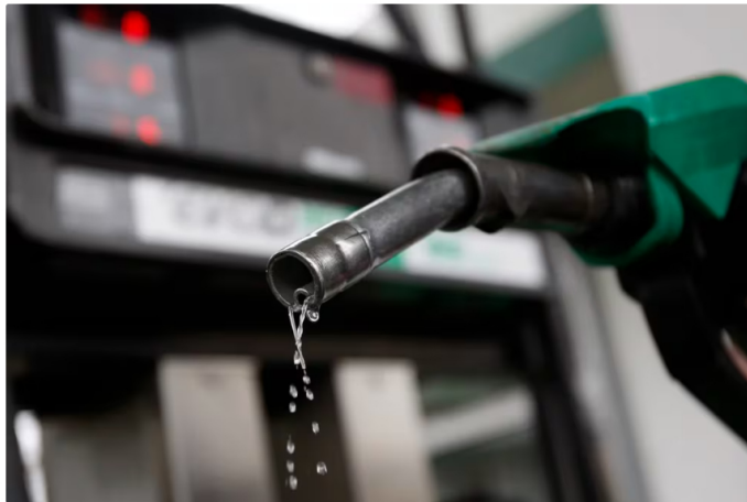
El precio del ACPM subirá para contrarrestar el déficit del Fepec

Durísimas noticias dio a conocer el presidente de Ecopetrol, Ricardo Roa. Informó que es inevitable que el precio del ACPM (diésel) suba de precio muy pronto.