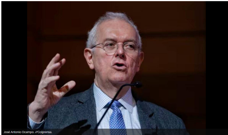
José Antonio Ocampo.

De acuerdo con José Antonio Ocampo, exministro de Hacienda, la caída en las utilidades de Ecopetrol era previsible y no representa una alarma.