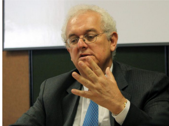
Exministro de Hacienda, José Antonio Ocampo.