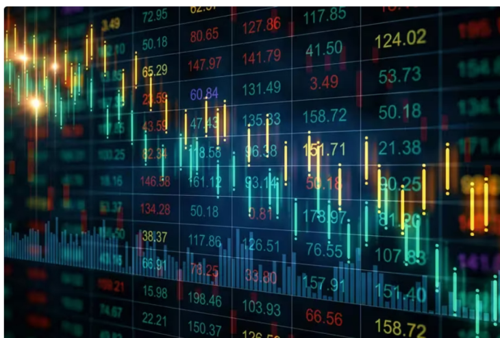
Acción de Ecopetrol cae: precio y cotización en bolsa hoy 4 de marzo de 2024

Así se comportan las acciones de Ecopetrol en la Bolsa de Valores de Colombia este 4 de marzo