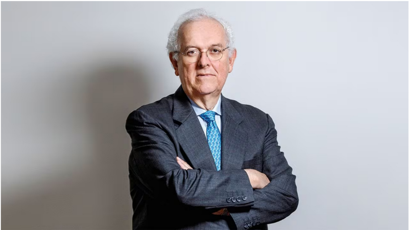
José Antonio Ocampo, exministro de Hacienda.