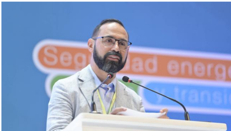
El ministro Andrés Camacho en la Cumbre Petróleo y Gas.