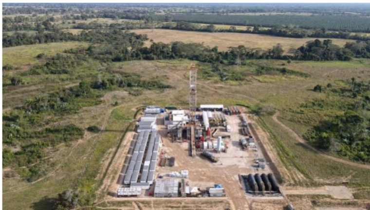
Pozo de exploración Chimela. Imagen de referencia.

Venimos trabajando tanto en los cronogramas de Ecopetrol para el gas offshore como habilitando otras medidas administrativas desde el Ministerio de Minas y Energía para habilitar una infraestructura que permita sacar mayor provecho del gas que está en el piedemonte llanero a través de poliductos multifase que permitan usar los ductos que tenemos, la infraestructura que tenemos de Ecopetrol , para poner allí gas disponible para el sistema de transmisión nacional de gas.