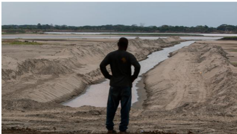
La preocupación de los agricultores es grande por la falta de agua y las pérdidas que han tenido por la sequía en el sur del Atlántico.

Los análisis del Ideam muestran que nos acercamos a un periodo de neutralidad climática. Entonces yo creo que nos queda el último mes de sequía en marzo. Hay que prepararnos para este último periodo. No hay que bajar la guardia, pero hemos venido preparando todas las condiciones para asegurar la energía que requiere el país, el abastecimiento y el cubrimiento de la demanda.