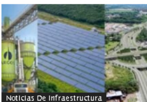
Noticias De Infraestructura

BanRep le revela al Congreso cuándo la inflación en Colombia volvería al 3 %