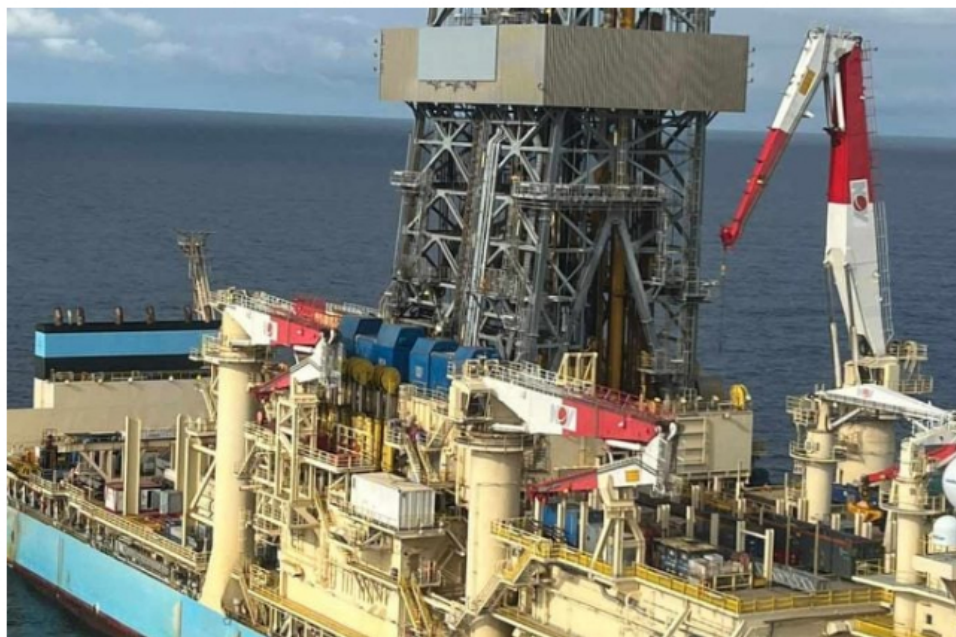
Los planes de exploración offshore de Ecopetrol tras resultados de pozos Orca.

Sobre el revuelo que ha causado la exploración costa afuera (offshore) de Ecopetrol , el presidente de la petrolera destacó que se mantendrá el plan de inversiones en 2024 para la búsqueda de energéticos en el Caribe colombiano que es del orden de US$357 millones.