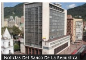
Noticias Del Banco De La República

BanRep le revela al Congreso cuándo la inflación en Colombia volvería al 3 %