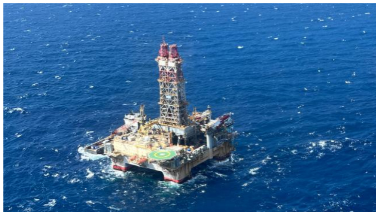
Pozo Orca Norte-1