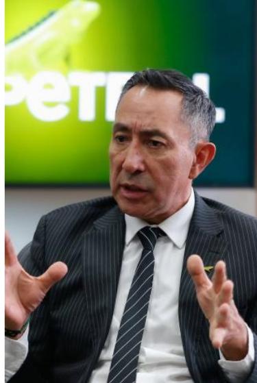
Ricardo Roa presidente de Ecopetrol .

✔ ISA va tras las 2 primeras vías 5G que adjudicará el gobierno de Gustavo Petro en 2024