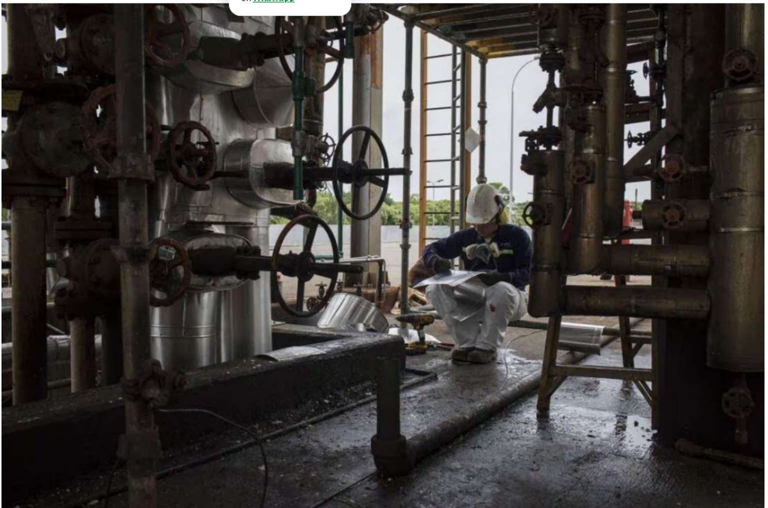
Refinería de Barrancabermeja. Imagen de referencia.