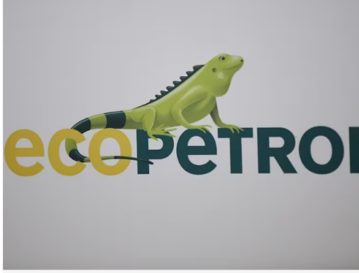
Imagen de referencia de Ecopetrol.

Las utilidades netas de Ecopetrol en 2023 cayeron casi a la mitad de las que se habían logrado durante el 2022; la tasa de cambio y la reforma tributaria son las principales razones.