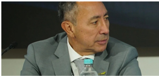
Ricardo Roa, presidente de Ecopetrol, entregó detalles de los resultados de 2023.

Entre tanto resaltó seis puntos clave en los resultados de Ecopetrol: