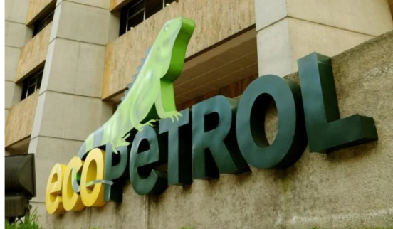
Ecopetrol redujo emisiones de CO2: similar a 197 días sin carro en Bogotá.

La petrolera colombiana Ecopetrol dio a conocer este jueves -29 de febrero de 2024- sus estados financieros con corte a 2023: entre los cuales se informó que su utilidad neta tuvo una fuerte caída.