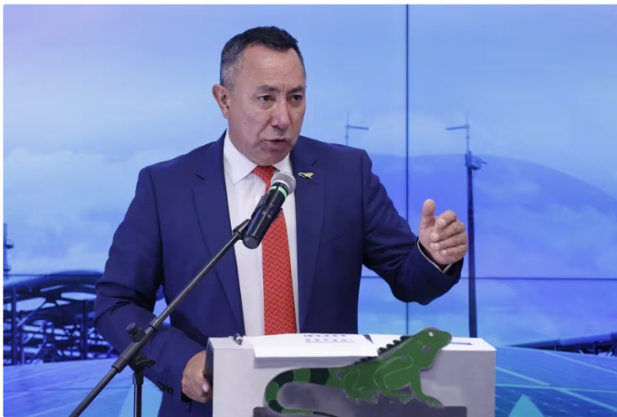
Presidente de Ecopetrol atribuye caída de utilidades a bajos precios del petróleo y reforma tributaria

Además, Roa explicó que la producción de crudo de Ecopetrol está estrechamente ligada a los niveles de precio en el mercado global, con el Brent como referencia internacional. En este sentido, señaló que las fluctuaciones en los precios del petróleo influyen en las expectativas de producción de la empresa.