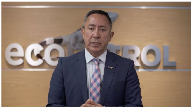
Ricardo Roa Barragán, presidente de Ecopetrol

Las ganancias netas fueron de $19,1 billones, ante las altas tasas de tributación, las presiones inflacionarias y el cubrimiento de déficits. En el último trimestre del año pasado registró ingresos de $54,8 billones.