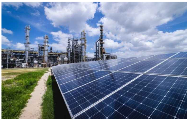
PANELES SOLARES de Ecopetrol.

La subordinada de Ecopetrol podría recibir acciones preferenciales convertibles en el 19,9% del capital común de McDermott International Ltd