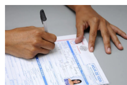
ECONOMÍA Desempleo subió en Bucaramanga durante enero