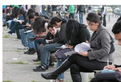
ECONOMÍA Desempleo en Colombia sigue siendo del 12,7%