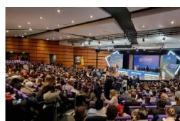
ECONOMÍA Bucaramanga presente en la mayor vitrina turística del