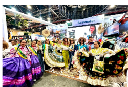
ECONOMÍA Bucaramanga se tomó la Feria ANATO 2024