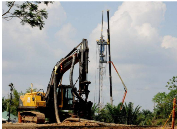
Según Ecopetrol, en exploración el año pasado lograron una tasa de éxito del 50%.

El índice de vida de las reservas cayó de 8,4 años a 7,6 años. La compañía dijo que están buscando aumentarlas, por lo que están revisando los contratos suspendidos.