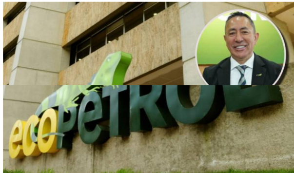
Al finalizar el 2023, Ecopetrol espera contar con al menos 900 megavatios de capacidad a partir de fuentes no convencionales de energía renovable.

La utilidad neta de la petrolera el año pasado se ubicó en $19,1 billones, dato inferior a los $33,4 billones obtenidos en 2022.