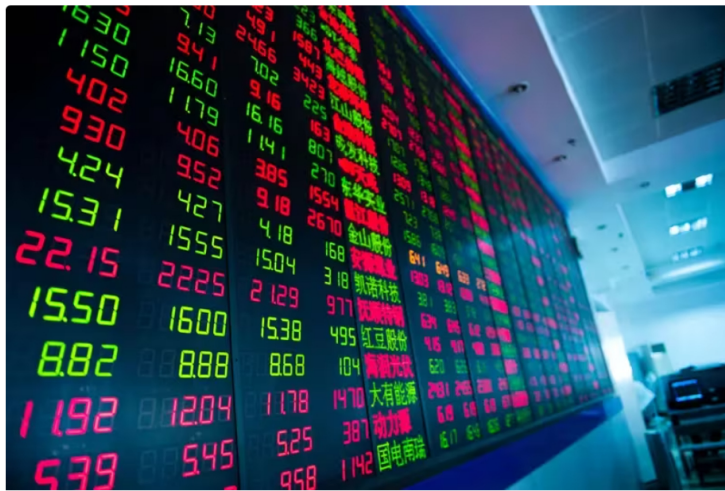
Acción de Ecopetrol, al alza: precio y cotización en bolsa hoy 29 de febrero de 2024. Crédito: (Shutterstock)

Así se comportan las acciones de Ecopetrol en la Bolsa de Valores de Colombia este 29 de febrero