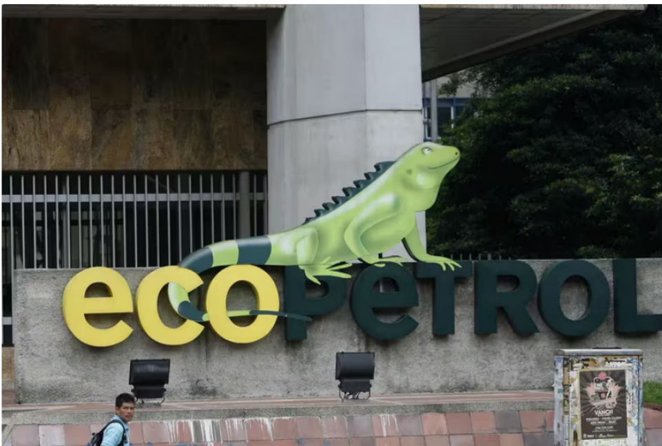
Ricardo Roa, presidente de Ecopetrol , anunció en el marco del Congreso de Andesco, la hoja de ruta que garantice el abastecimiento

Ante las preocupaciones por las sanciones de la Oficina de Control de Bienes Extranjeros (OFAC) de Estados Unidos al sector de petróleo y gas de Venezuela, el directivo expresó que pronto se podría anunciar una flexibilización en la medida.