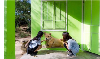
La aldea con pintura mural de Tam Thanh-otro destino atractivo de Quang Nam