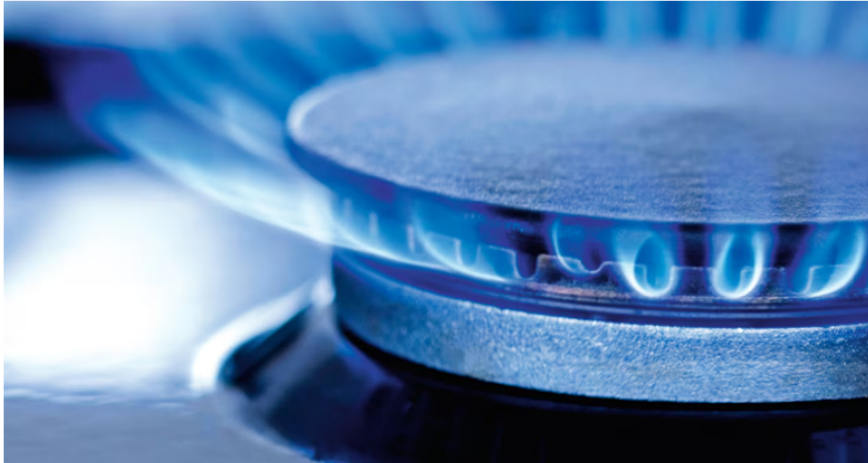
La importación de gas desde Venezuela, con los riesgos por las sanciones de Estados Unidos y la incertidumbre por el estado en que se encuentra el gasoducto y la disponibilidad de campos cercanos a la frontera.

Y en materia de importación, Ecopetrol insiste en la posibilidad de traer gas de Venezuela, a pesar de los riesgos legales y operativos. Roa señaló que con PDVSA Gas y Cenit –filial de la petrolera colombiana– hicieron un recorrido por el gasoducto en el tramo de Colombia, de unos 98 kilómetros, “y se ha identificado que en una ventana de tiempo entre 10 y 14 meses podría estar el gasoducto en disposición física”. Aunque la capacidad del gasoducto es de 300 millones de pies cúbicos por día, se analiza importar entre 30 y 50 millones.