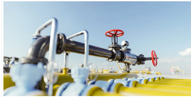
El gas natural representa el 23% de la generación de energía, siendo en Colombia la segunda fuente de generación eléctrica. Foto Naturgas.