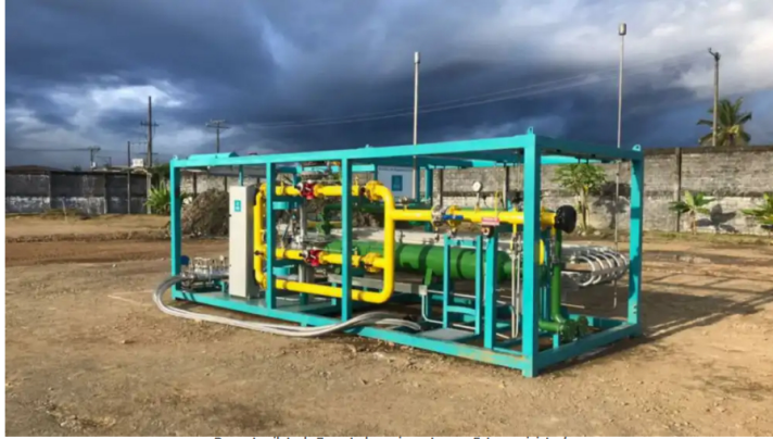
Proyecto piloto de Ecopetrol para importar gas

Por: Redacción BLU Radio | 28 de Junio, 2024