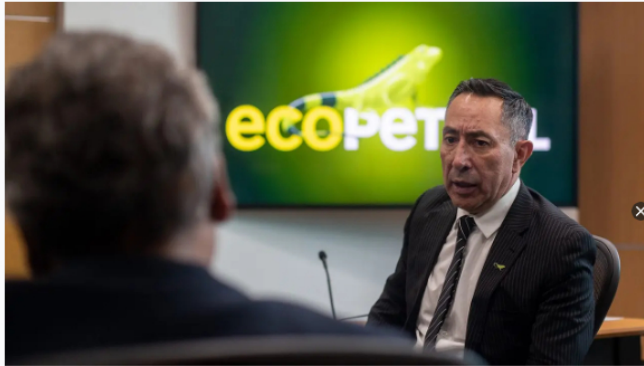
Ricardo Roa Barragán, presidente de Ecopetrol.

Forbes Staff | junio 27, 2024 @ 2:06:02 pm