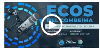
#AgendaInteractiva | Fundes recibió el aval de 7 nuevos programas, la mayoría en posgrados