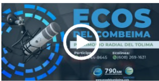
#MiCasaEstáDeFiesta | ¡Celebremos el Día de la Achira!