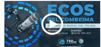
#AgendaInteractiva | Fundes recibió el aval de 7 nuevos programas, la mayoría en posgrados