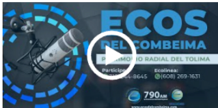
#MiCasaEstáDeFiesta | ¡Celebremos el Día de la Achira!