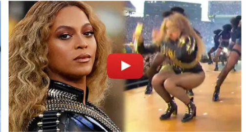
Brainberries Caídas y desnudos: 10 errores en vivo que nadie olvidará