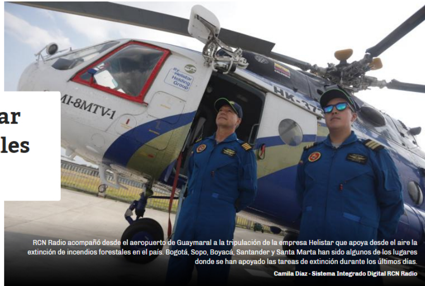
RCN Radio acompañó desde el aeropuerto de Guaymaral a la tripulación de la empresa Helistar que apoya desde el aire la extinción de incendios forestales en el país. Bogotá, Sopo, Boyacá, Santander y Santa Marta han sido algunos de los lugares donde se han apoyado las tareas de extinción durante los últimos días.

Camila Diaz - Sistema Integrado Digital RCN Radio