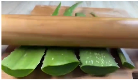
Vimvital Médicos: ¡Quítenlo de su dieta y su hipertensión desaparecerá!