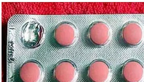
Vimvital Esta pastilla olvidada limpia las venas a un ritmo impresionante