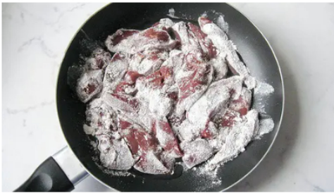
Colgazeta ¡No lo comas nunca! ¡Causa cáncer! Lo comemos todos los días