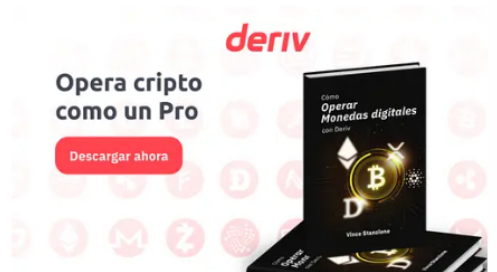
Deriv Cryptocurrency E-Book Descarga el ebook gratis