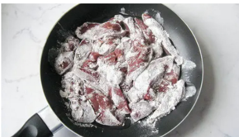
Colgazeta ¡No lo comas nunca! ¡Causa cáncer! Lo comemos todos los días