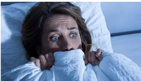
Colgazeta Estos sueños indican una muerte inminente: recuérdalos siempre