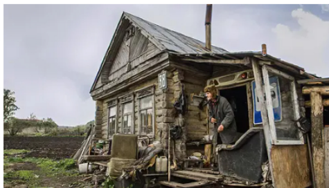
Colgazeta 15 años en un cobertizo: millonario deja a todos atónitos