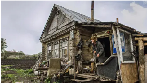
Colgazeta 15 años en un cobertizo: millonario deja a todos atónitos