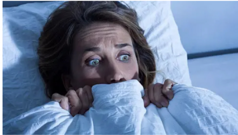
Colgazeta Estos sueños indican una muerte inminente: recuérdalos siempre