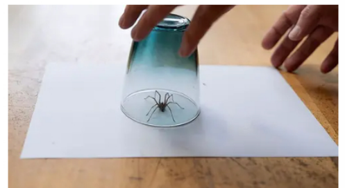
Colgazeta Nunca mates arañas en casa: la razón te sorprenderá