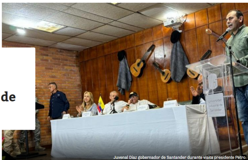
Juvenal Díaz gobernador de Santander durante visita presidente Petro.