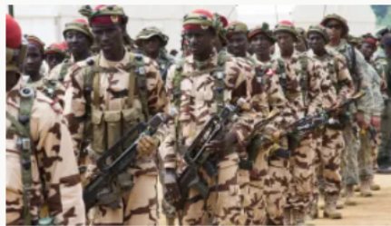
Haití: Llegan policías extranjeros para combatir la violencia