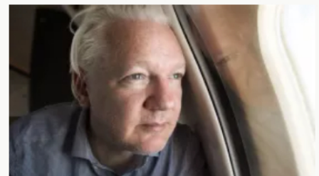
Julián Assange de Wikileaks en libertad, acepta cargos y queda con millonaria deuda