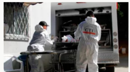
En un cementerio del Cesar encuentran restos de 38 personas declaradas como desaparecidas