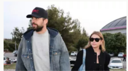
Gerard Piqué y Clara Chía reaparecen afectuosos en público pese a perder juicio contra Paparazzi