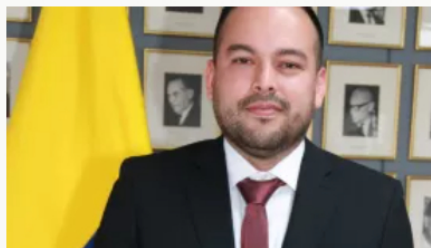
Gobierno prepara seis decretos para sustituir artículos no aprobados en reforma laboral