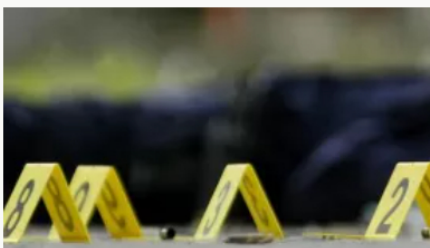
Masacre en Rionegro, Antioquia, asesinan a seis personas