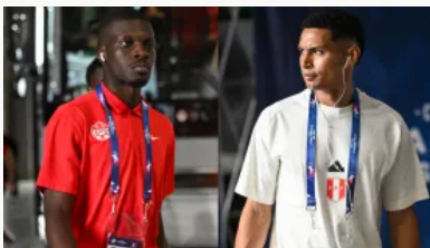
Copa América USA 2024: Canadá vence a Perú y lo deja al borde de la eliminación