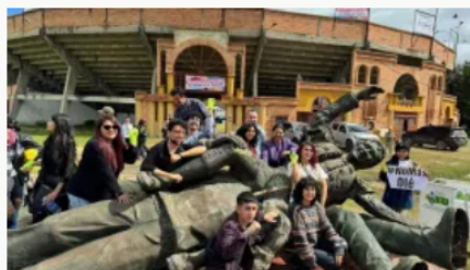
Tumban escultura de torero César Rincón en Duitama y enviarán pedazos a Bogotá para museo del DPS