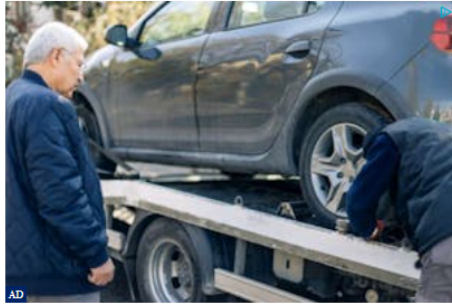
Muchas personas mayores desconocen que el seguro de coche por edad es casi gratuito. (Infórmese aquí)