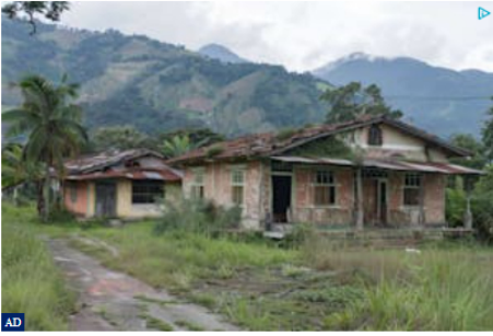
Se venden inmuebles abandonados a bajo costo en Bogotá: precios inimaginables