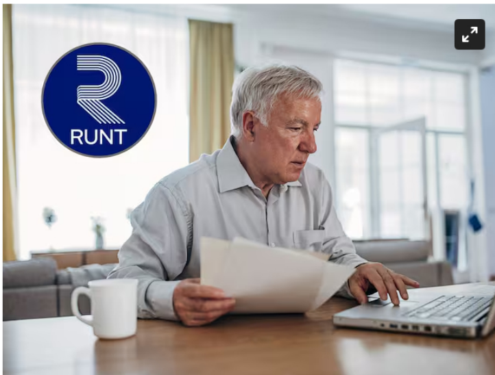
Hombre usando un computador para actualizar sus datos. En el círculo, el logo del RUNT

Gremios en el Valle piden reconsiderar el incremento en el precio del ACPM