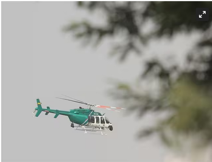
Helistar SAS tomará acciones legales para defenderse en el caso Ecopetrol (That)

La compañía tomará medidas en Colombia y Estados Unidos para proteger su reputación, rechazando señalamientos que la vinculan al "cartel de los helicópteros" y solicitando prácticas justas en las investigaciones de la SIC