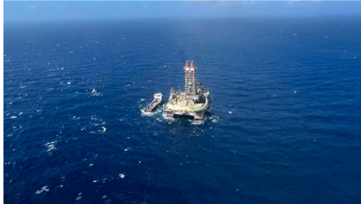
Ecopetrol y Petrobras anuncian el inicio de la perforación del pozo Uchuva-2, en el Bloque Tayrona, en el Caribe colombiano.

En el Bloque Tayrona, Petrobras es operador con una participación del 44,4% y Ecopetrol con el 55,6 %.