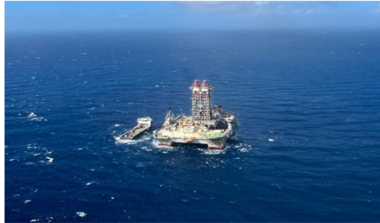
Plataforma Uchuva de Ecopetrol.

Ecopetrol y Petrobras dieron a conocer el inicio de la perforación del pozo Uchuva-2, en el Bloque Tayrona, en el Caribe colombiano. Según la estatal petrolera, el inicio del proceso se da como parte del compromiso de incorporar gas natural.