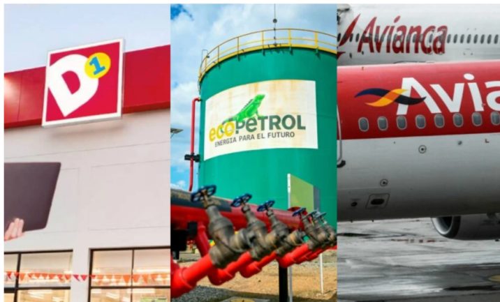
Ecopetrol, D1, Avianca y Terpel, el ranking de las empresas más grandes del país

Las 1.000 empresas más grandes del país tuvieron un incremento del 7.9% en ingresos. Solo las 10 primera lograron ingresos por 313 billones.