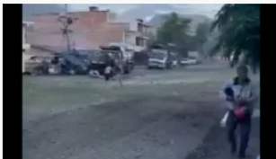
Nuevo ataque terrorista: reportan carrobomba en el municipio de Taminango, Nariño