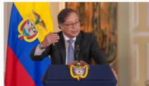
Estado de excepción: la propuesta de Petro para contratar obras públicas