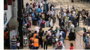
Durante los primeros cinco meses del año se movilizaron 22 millones de personas por vía aérea