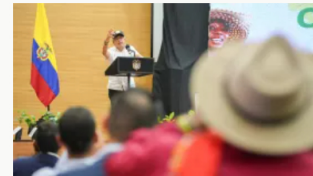
Presidente Petro denunció el reclutamiento de 350 niños indígenas usados como 'escudos' de grupos narcotraficantes