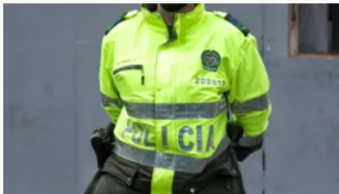
Seis policías heridos al caer en campo minado en San Pablo, Bolívar