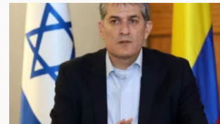
Partida del embajador de Israel Gali Dagan entristece a comunidades judías colombianas