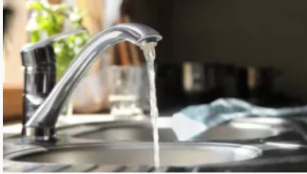
Restricciones de agua en Bogotá programadas para este sábado 22 de junio