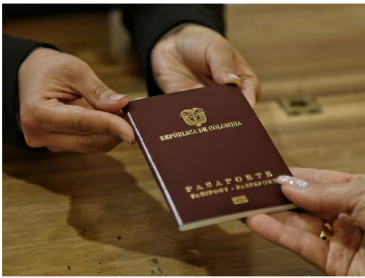
Persona recibiendo su pasaporte colombiano