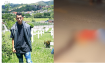
Asesinado joven en casco urbano de Puerto Wilches