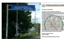
En panfleto las AGC amenazan barrios de Puerto Wilches