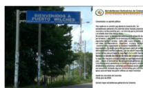
En panfleto de las AGC amenazan barrios de Puerto Wilches