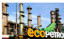
Ecopetrol exporta las primeras 2.500 toneladas de asfalto sólido