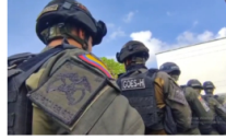
El GOES-H capturó a cuatro personas por hurto de hidrocarburos