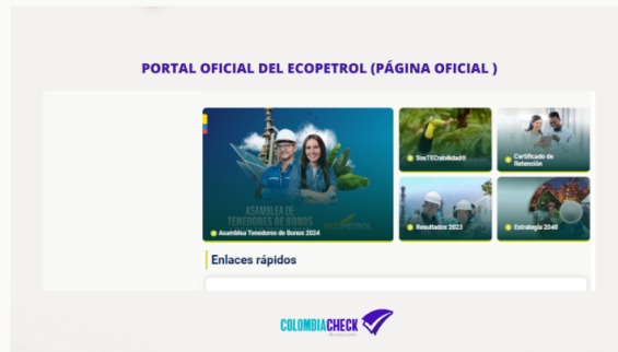
Página oficial de la empresa Ecopetrol.

Además, informó que este tipo de ofertas solo se divulgan en sus canales oficiales, específicamente en su web ( https://www.ecopetrol.com.co/wps/portal/ ). Allí, los interesados pueden encontrar un enlace interno que redirige a la opción " Trabaje con nosotros ", donde se les solicita registrarse para cargar su hoja de vida y monitorear en tiempo real el estado de las vacantes, así como el estado de sus solicitudes laborales para las posteriores entrevistas de selección y contratación.