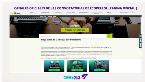
Página de la empresa Ecopetrol y enlace a sus vacantes laborales

En la misma página también hay una sección que advierte la existencia de falsas ofertas laborales como una de las diversas modalidades de engaño. Al respecto, indica :