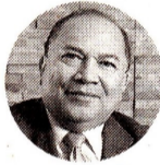
Amylkar Acosta Exministro de Minas y Energía

“Era de esperar que ello tuviera eco en los Estados Unidos, dada la circunstancia de que sus acciones están listadas en la Bolsa de Nueva York y sujeta a sus leyes federales de valores”.