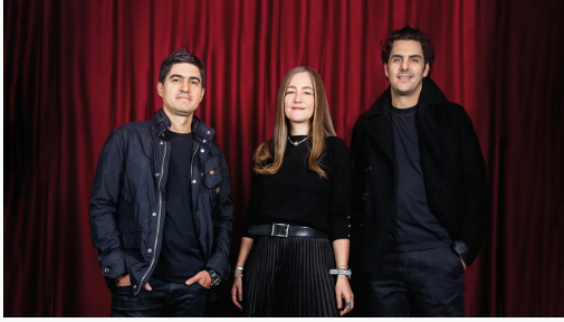
Los 25 mejores CMOs de Colombia 2024