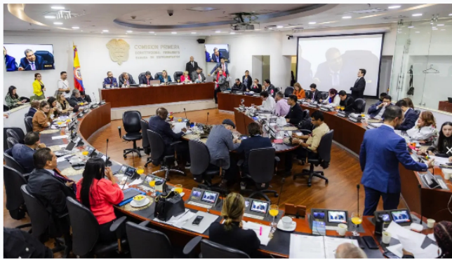
Comisión Primera de la Cámara de Representantes.

Forbes Staff | junio 19, 2024 @ 4:06:18 pm